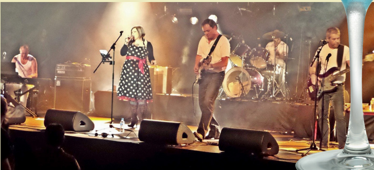
Repli au Trait d'Union en cas de mauvais temps