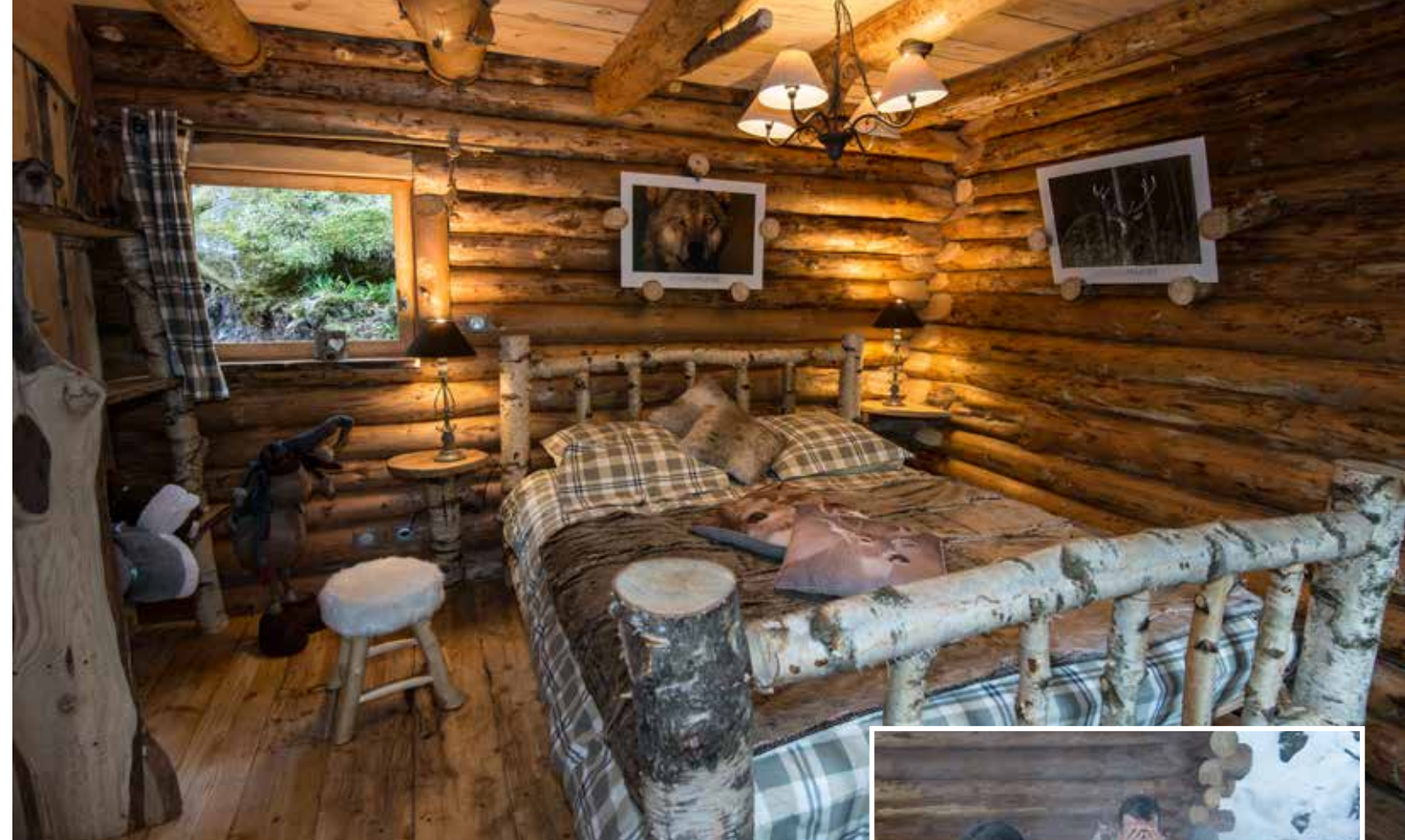
La Fuste du Trappeur Moment de détente dans le bain finlandais