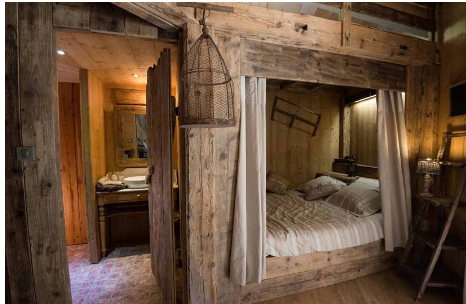
Le Grenier de mon Père L'univers authentique d'un parfum d'antan et le bien être des temps modernes