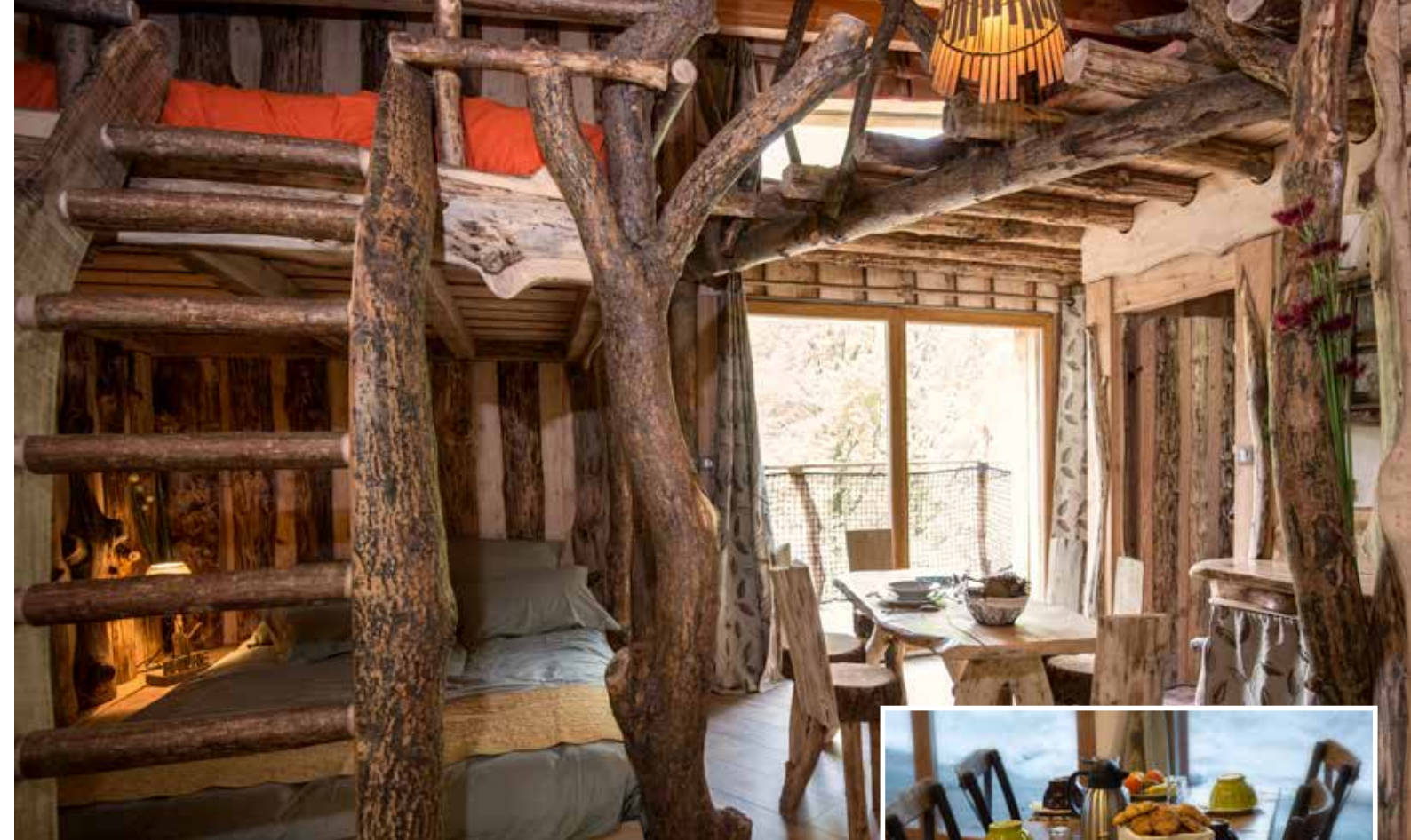
Les Couleurs d'Automne Un hymne au bois dans une chambre-cabane chatoyante