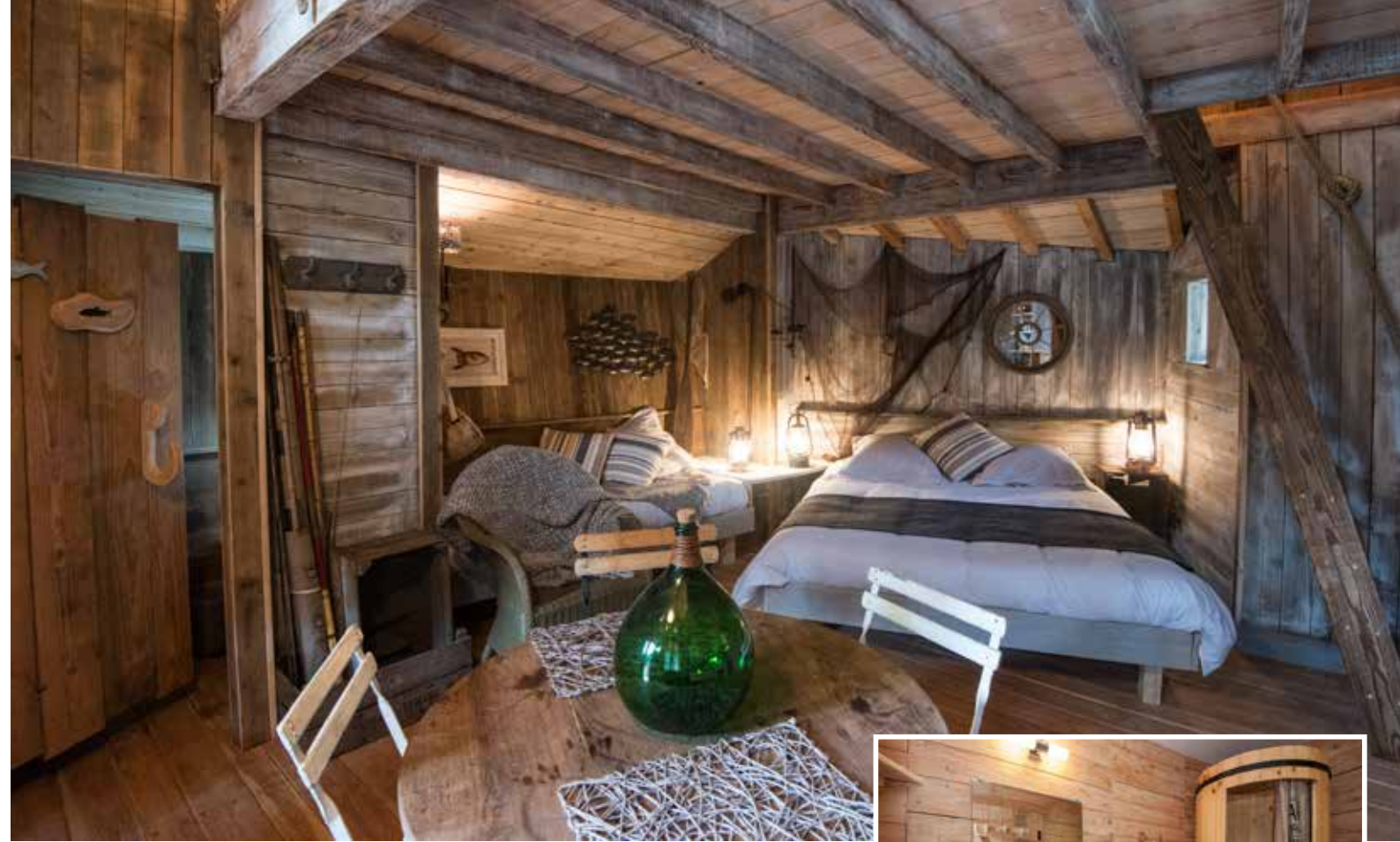
La Cabane du Pêcheur Cabane sur pilotis au bord d'un étang